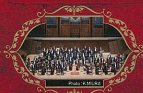
新日本フィルハーモニー交響楽団